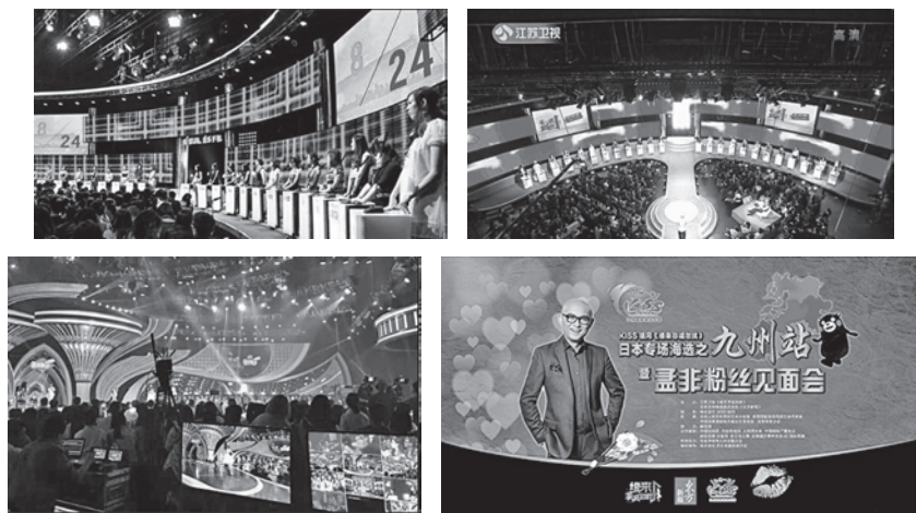
图1 江苏卫视婚恋交友节目“非常勿扰”现场及活动宣传海报

其节目的时效性与真实性被广大电视观众寄予了空前的期待，自节目开播以来就收视率飙升。参加此节目的男女嘉宾需通过江苏卫视“非常勿扰”节目组官方网站进行报名，经节目组审查即可成为节目出场嘉宾。同时该节目也与中国最大的两家婚恋交友网站结成战略合作伙伴，所有希望参加节目的报名者必须首先完成在「世纪佳缘网」和「百合网」的实名注册，亦接受在线婚恋交流与咨询。拓宽交友的途径，增加了交友的机会，以传统媒体和网络媒体相结合，最大程度地提高婚恋交友的成功机率。同时期中国各地的卫星电视台纷纷开播此类节目，也在当地甚至全国也取得了相当可观的收视率。