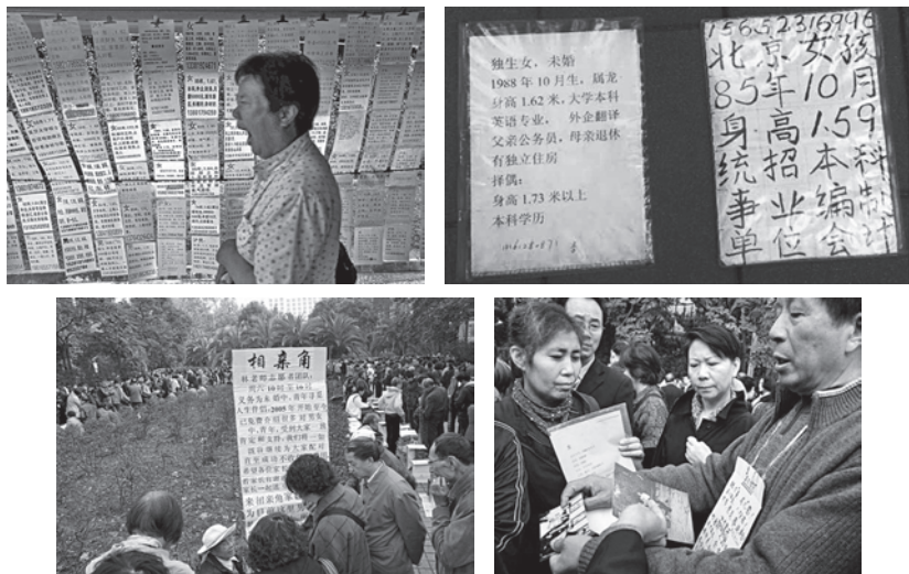
图3 北京中山公园内的“相亲角”